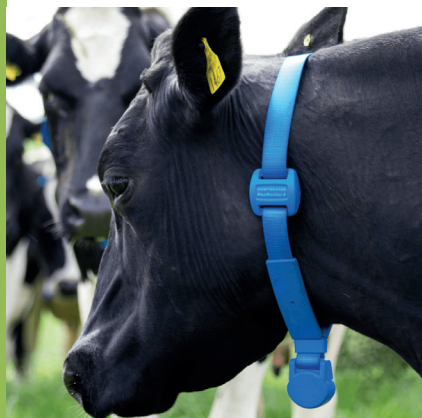
Sensori di monitoraggio