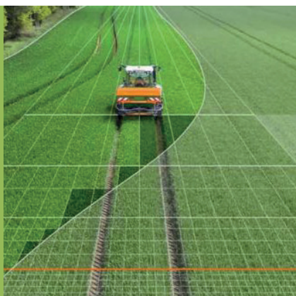
BIG data analysis